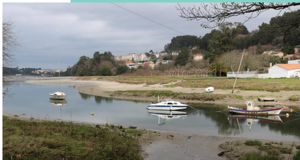
16-Esteiro do río Lambre. O Lambre nace no Monte da Pena da Uz (Monfero) e desemboca na Ponte do Porco na ría de Betanzos facendo fronteira entre os concellos de Paderne e Miño.

LIC/ZEC "Betanzos-Mandeo" No concello de Miño protexe o tramo entre a desembocadura do Lambre e a praia da Ribeira, unha área de cantís co fondo areoso na que quedan ao descuberto amplos areas ao debalar a marea.