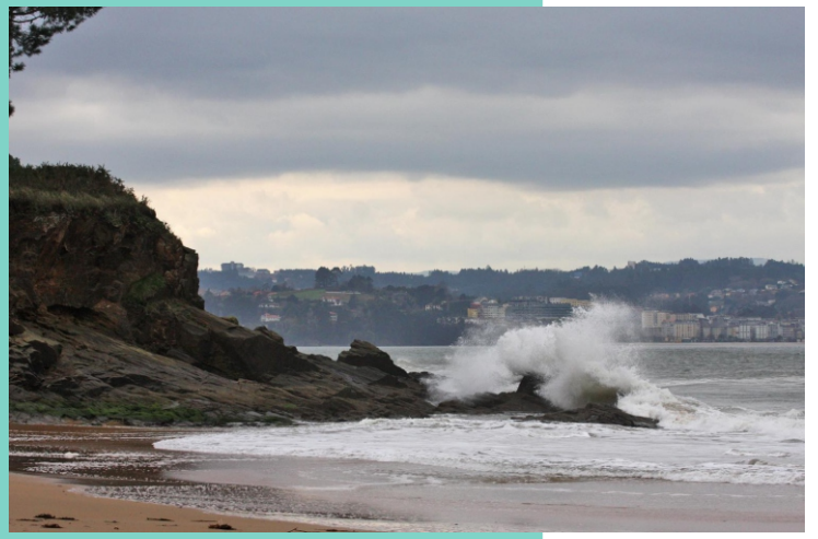
Punta que separa as praias de San Pedro e de Marín