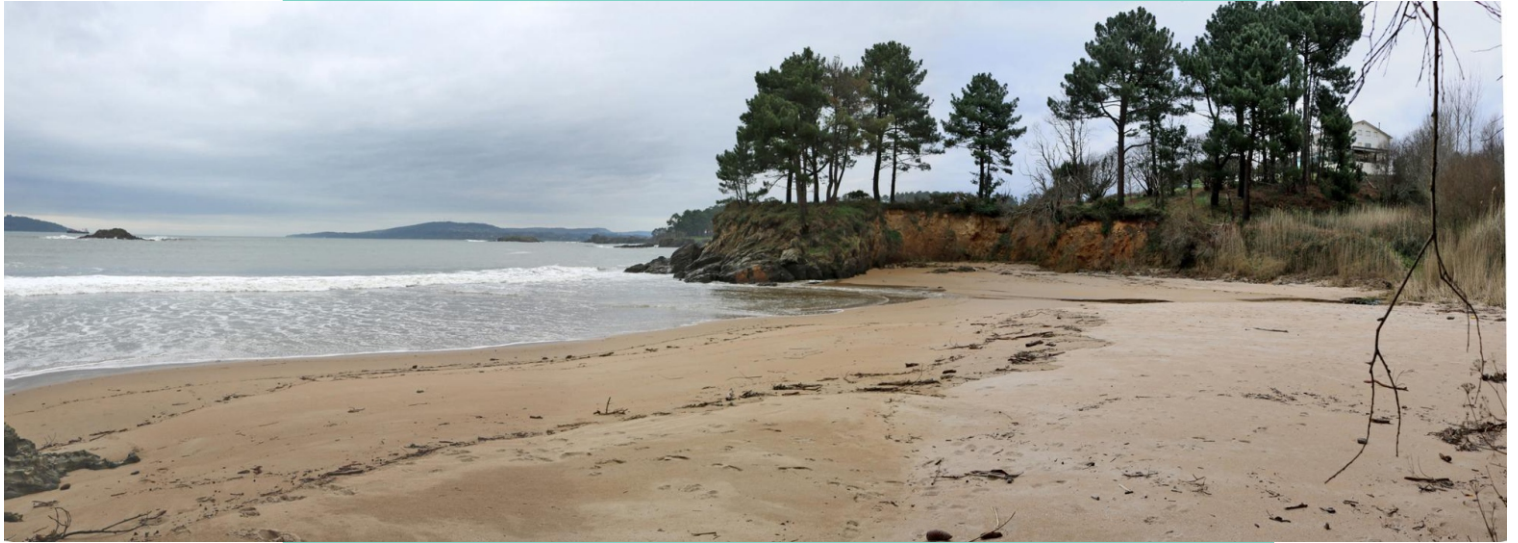
3-Praia de Marín