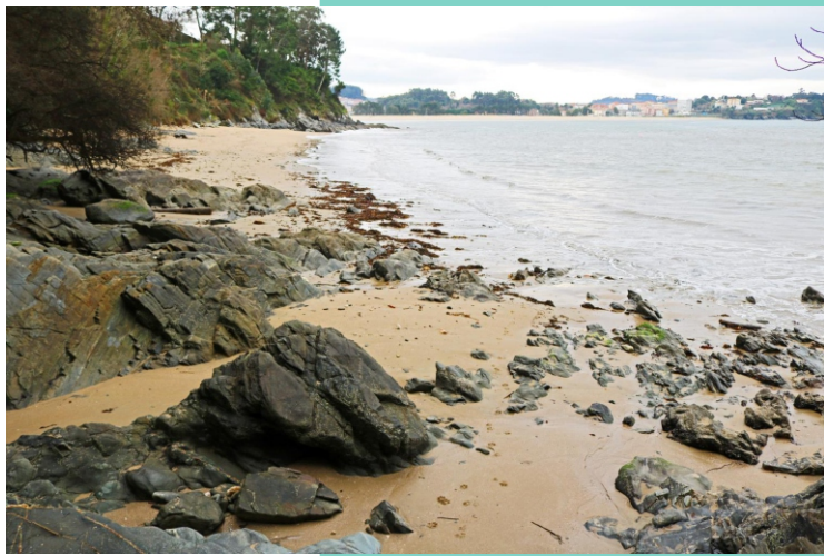
6-Praia do Lago