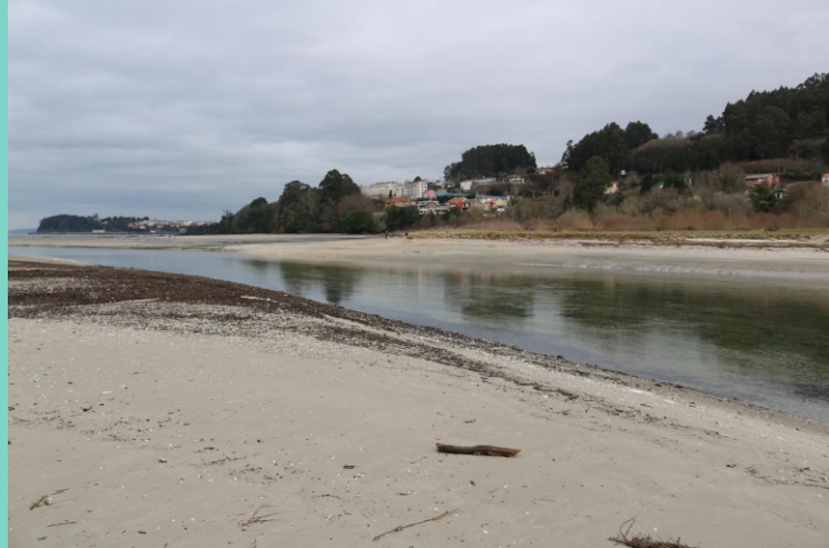
15-Praia da Alameda. Ponte do Porco.