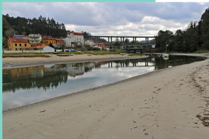
Praia da Ponte do Porco.