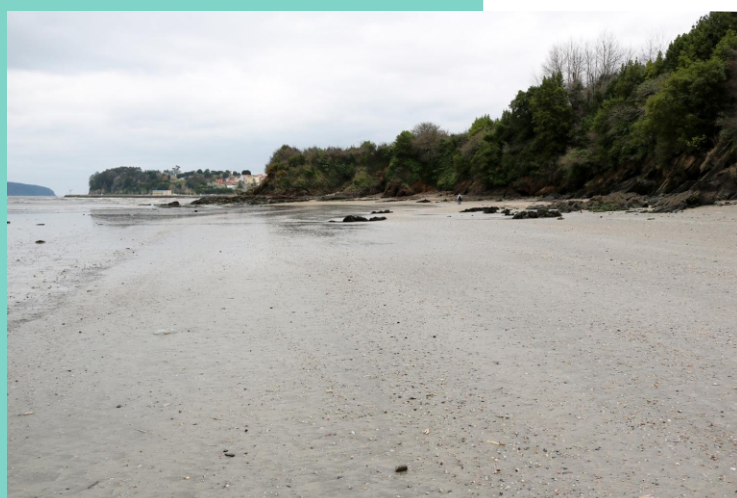
13-Punta Sumiño e cantís entre a punta de Gafo e punta Sumiño