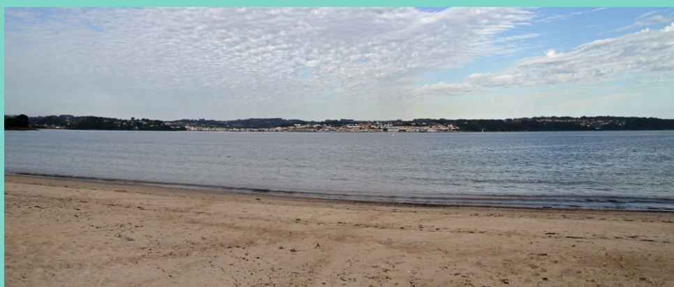
A Ría de Betanzos entre a praia de Miño e a costa de Sada

O litoral de Miño está formado por cantís, que reciben as ondas do mar aberto pola ampla boca da ría de Betanzos, e praias que se acollen nos seos que se forman entre as puntas. O elemento máis destacado é a praia Grande e a súa frecha na que se amorea a area coa que o mar quere pechar a saída do río Baxoi e a forza coa que a corrente do río se abre paso.