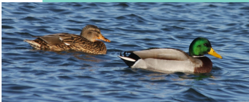
Parella de lavancos, unha das aves máis comúns dos esteiros e marismas.