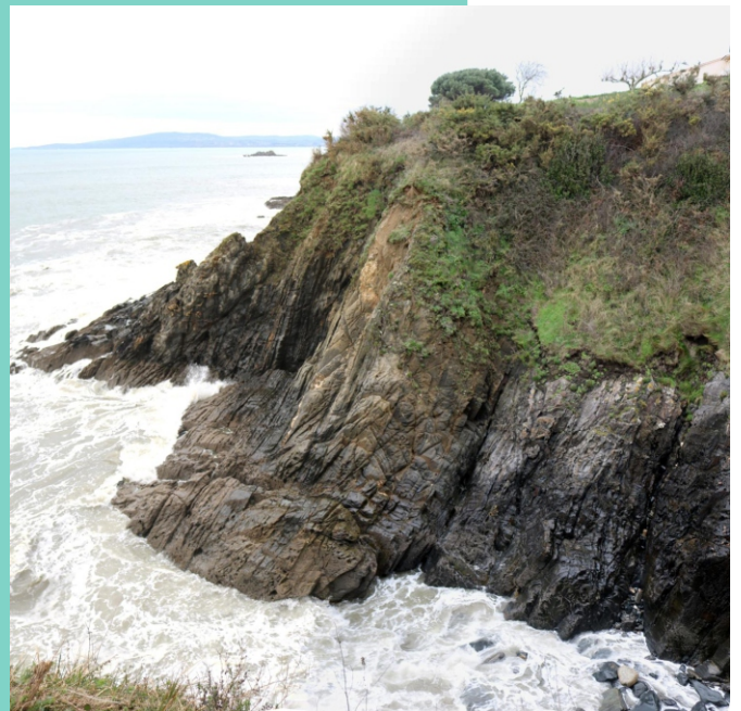
Punta do Toxo