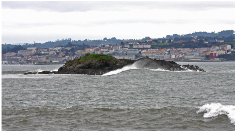
1- Illa do Carbón

Mide 12 km de fondo e presenta dous sectores ben diferenciados. O primeiro, de Betanzos ata a ponte do Pedrido, é un esteiro típico onde sedimentan os materiais transportados polo río Mandeo. O segundo, entre as puntas Lavadoira e Torella, é máis amplo e conflúe coa ría de Ares. As rochas dominantes son xistos, filitas e lousas. É unha importante zona marisqueira.