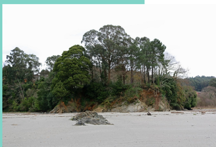
14-Punta do Gafo