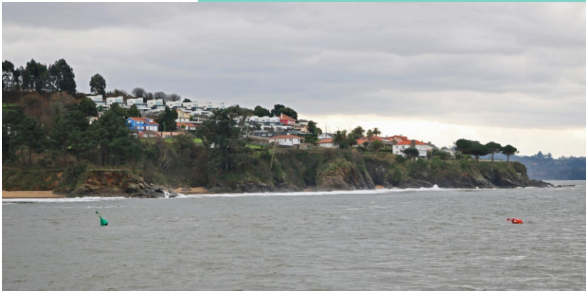
4-Punta do Toxo