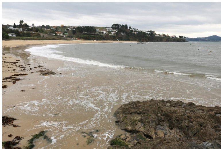
2-Praia de San Pedro (Perbes)