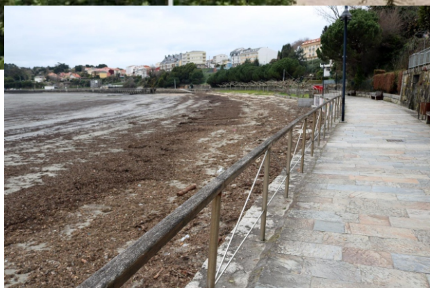
12-Praia Pequena de Miño, de Sumiño ou da Ribeira. No inverno as praias próximas ás desembocaduras dos ríos quedan cubertas polos materiais arrastrados polas correntes, maiormente follas secas e restos de madeira.